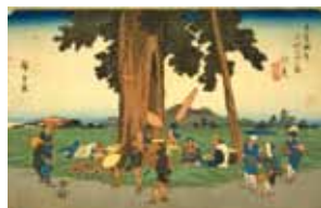
広重 画「木曾海道六拾九次之内伏見」 (請求記号 寄別2-2-1-5) ※弁当を食べている場面。

詳細は https://www.ndl.go.jp/jp/kansai/events/index.html に掲載予定