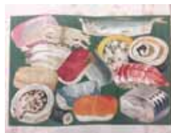
小泉清三郎 (汪外) 著「家庭昼のつけかた」 大倉書店、明43.7(請求記号 246-213)